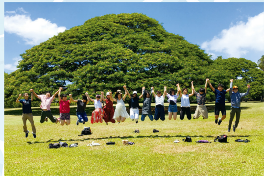
2019年度青少年ホームステイ派遣事業の様子 この〜木何の木 気になる木♪