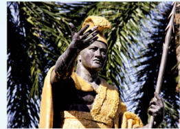
ビッグアイランド生誕の カメハメハ大王