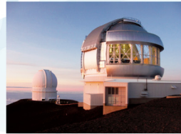
マウナケア火山にある 日本国立天文台のすばる望遠鏡