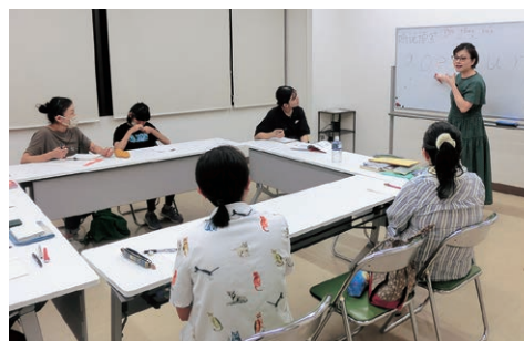
中国語基礎クラス